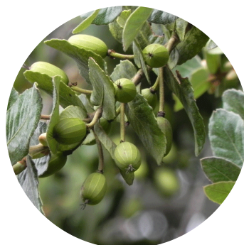
M. Teresa Eyzaguirre

Árbol siempreverde, corpulento, de copa redondeada y follaje denso. Llega a medir hasta 40 m de altura y su tronco alcanza un diámetro de unos 2 m. La corteza es lisa, de color pardo y con fisuras longitudinales. Lo más característico de esta especie son sus flores blancas, de gran tamaño y perfumadas