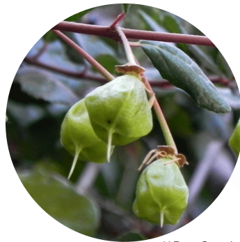
M. Teresa Eyzaguirre

Árbol siempreverde, de abundantes ramas y copa redondeada. Alcanza a crecer hasta 15 m de altura y su tronco mide cerca de 1 m de diámetro. La corteza es gris e irregularmente agrietada.