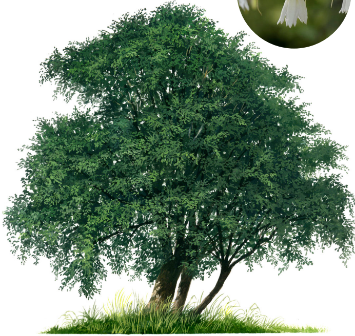
Andrés Jullian F.

Árbol siempreverde, de abundantes ramas y copa redondeada. Alcanza a crecer hasta 15 m de altura y su tronco mide cerca de 1 m de diámetro. La corteza es gris e irregularmente agrietada.