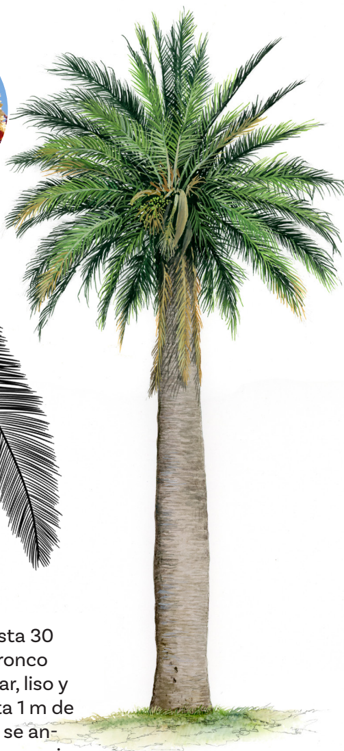
Andrés Jullian F.

Llega a medir hasta 30 m de altura. Su tronco es recto, columnar, liso y grisáceo, de hasta 1 m de diámetro, el cual se angosta en la parte superior de los árboles más longevos.