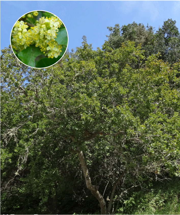
M. Teresa Eyzaguirre

Árbol siempreverde, de 4 a 8 m de altura y que puede alcanzar hasta 12 m. El tronco es tortuoso y llega a medir unos 10 cm de diámetro. La corteza, de color café, se descascara con la edad. Las hojas tienen un agradable aroma cítrico al ser molidas.