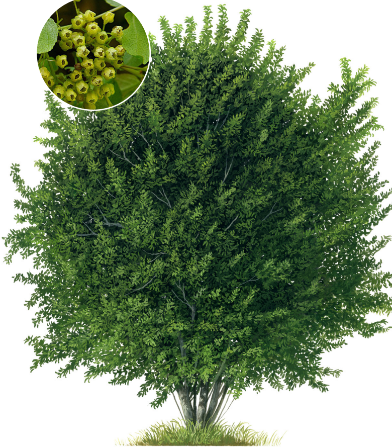
Andrés Julian F.

Árbol nativo siempre verde que puede alcanzar una altura de 4 a 5 m. Es una especie dioica (hay plantas macho (flor masculina) y hembra (flor femenina)). El tronco es corto y está frecuentemente inclinado por el peso de la copa, del que brotan cada año ramas secundarias muy largas, delgadas y flexibles, que crecen hasta la copa. El fruto es una baya negra brillante, jugosa y de sabor dulce que contiene entre 2 a 4 semillas.