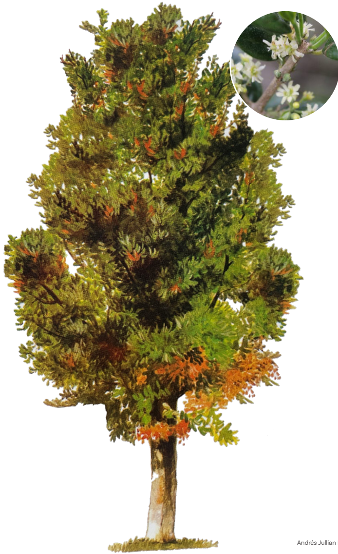
Andrés Jullian F.

Árbol siempreverde, de copa frondosa y globosa. Mide hasta 30 m de altura y su tronco alcanza unos 80 cm de diámetro. La corteza es gruesa y rugosa, de color café a cenicienta. Las hojas son brillantes, duras y grandes, de hasta 12 cm de longitud.